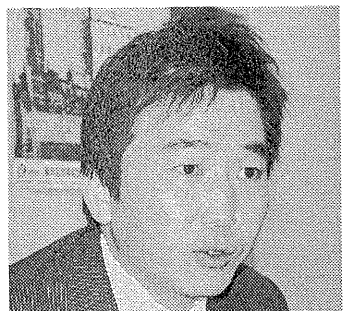
横浜建設業青年会 新会長

「とにかく会員のために頑張りたい」と思いを語る。対外的な事業の拡大よりも、今期はひとまず会内部の充実を図る。「多忙な中、時間を調整して参加する会員のためにも、社業に結び付いた役立つ